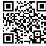
แจ้จ้งเรื่องร้องเรียน